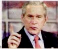
Präsident George W. Bush: Iran lieferte Waffen weiter.