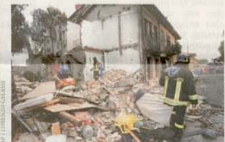
Trümmer: Häuser in der Nähe des Bahnhofs stürzten ein