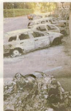
Zerstörung: Autos brannten völlig aus

Unterdessen berichtete der ORF, die Spur der Unglück-Waggons führt nach Österreich zur Firma GATX in Perchtoldsdorf. Unklar ist jedoch noch, ob GATX auch für die Wartung und Instandhaltung der Waggons zuständig ist. Gewerkschaften hatten wiederholt auf die mangelnde Sicherheit hingewiesen.