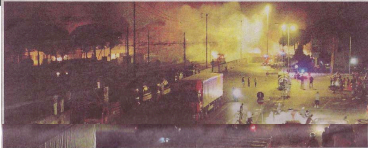
La stazione ferroviaria di Viareggio pochi attimi dopo l'esplosione del treno merci proveniente da Trecate e diretto a Gricignano d'Aversa: subito si è messa in moto la macchina dei soccorsi

Viareggio, un convoglio carico di gas deraglia e esplode in stazione: 16 le vittime