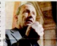
Pilz will Innenminister Plattner mit der Affäre konfrontieren.

Die Regierung hält sich zu der Causa der im Irak aufgetauchten Steyr-Gewehre bedeckt. Das Verteidigungsministerium verkündete lediglich, es sei in dieser Frage nicht zuständig. Die Spre-