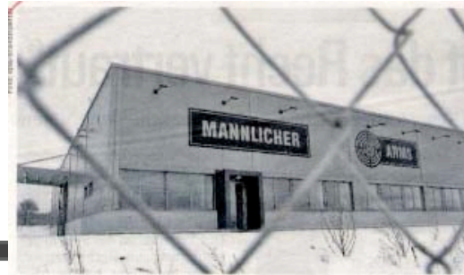
Steyr-Verantwortliche: Die Waffen werden seit Jahren nachgebaut!