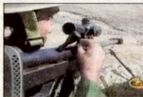
Iranischer Elitesoldat übt mit der Steyr-Waffe

30.000 Pistolen Gestern wurde auch bekannt, dass im Herbst vergangenen Jahres 30.000 Pistolen der heimischen Firma Glock an die irakische Polizei verkauft wurden. Das für die Genehmigung zuständige Wirtschaftsministerium sieht darin kein Problem: Einerseits fielen Pistolen nicht unter das Kriegsmaterialgesetz; andererseits hätten die irakischen Behörden den Sicherheitszweck nachweisen können, so das Ministerium gegenüber dem ORF-Radio. Laut US-Armee „verliert“ die irakische Polizei jede 20. Waffe.