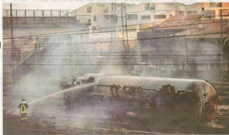
Löscharbeiten: Feuerwehr Einsatz am Bahnhof von Viareggio. Fünf von 12 Flüssiggas-Waggons entgleisten, eine Explosion war die Folge

Die Explosion eines Flüssiggas-Güterzuges verwüstete die toskanische Stadt. Mindestens 16 Menschen starben.